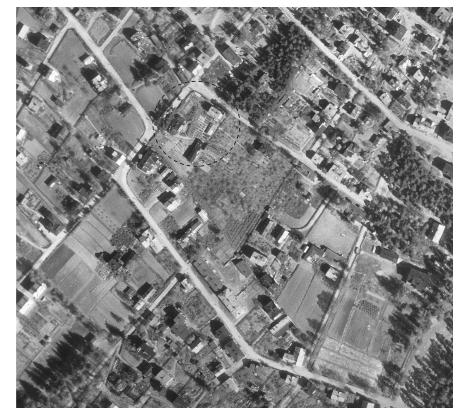
Ilmakuva vuodelta 1946